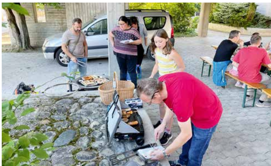
Merci aux parents pour leur collaboration durant ce temps festif.