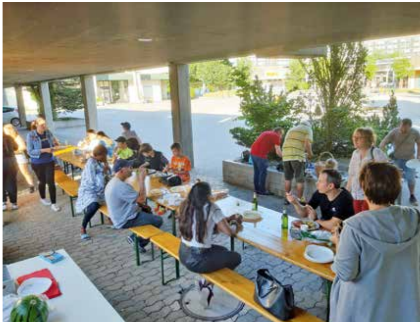
Une jolie tablée pour cette clôture des catés.