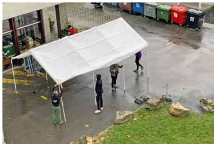
Montage coordonné de la tente de protection contre la pluie.