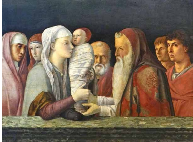
Ce mois de février, nous allons fêter la Présentation de Jésus au Temple.

Parlons d'une initiative partenariale qui se déroule depuis le mois de novembre dans nos locaux de la paroisse Saint-Pie X. La Fondation Colis du Cœur s'y est installée pour les distributions alimentaires. Le besoin de notre local s'explique par une très forte demande enregistrée par ladite fondation en raison de la crise pandémique liée au coronavirus. Il n'y a donc aucun doute, la précarité a significativement augmenté. Ainsi apprend-on dans un article paru dans la Tribune de Genève du 3 septembre dernier que «Le nombre de bénéficiaires