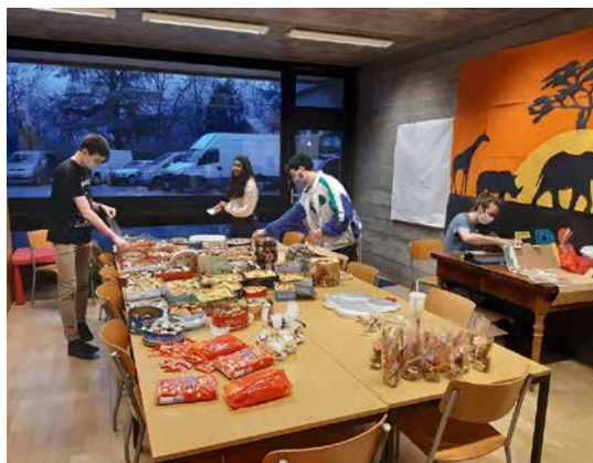
Le 23 décembre, mise en sachets-cadeaux des biscuits confectionnés le week-end précédent.

Les jeunes ont mis en place une distribution de paniers-repas de Noël le soir du 24, dans les locaux des cuisines scolaires de l'école du Lignon. Ils ont fait et reçu des biscuits qu'ils ont mis en sachets, organisé des inscriptions pour la distribution des repas, monté une tente à l'extérieur pour la file d'attente et bien sûr cuisiné pour ce repas de Noël que les gens ont pu ramener chez eux. Beaucoup de félicitations leur ont été adressées et une jolie reconnaissance: en photo à la une de la Tribune du 21 décembre.