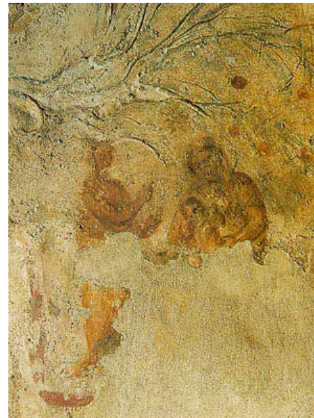
Marie allaitant. Rome catacombes de Sainte-Priscille, III e siècle.