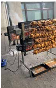
Une tradition a pu être conservée: le rôtissage des poulets!