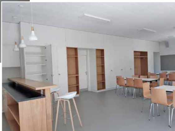
Ici on voit également les armoires que pourront occuper certains groupes paroissiaux.