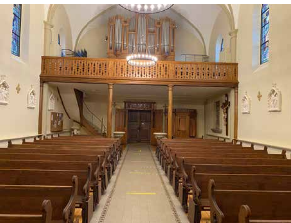
Vue de l'intérieur.