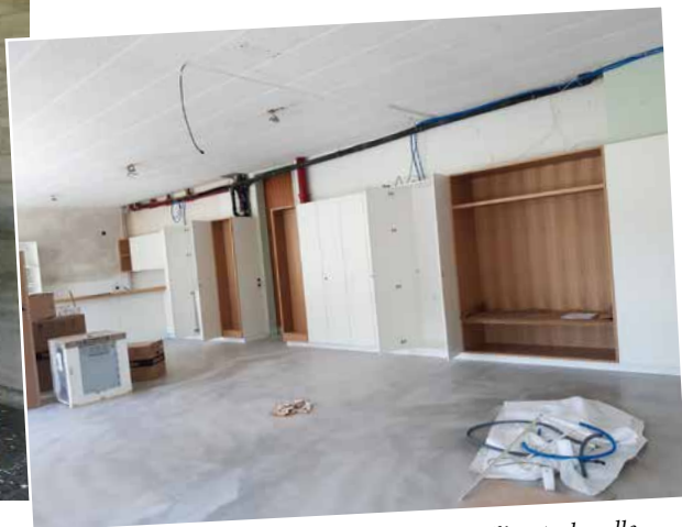
Le bar de la cuisine ayant été placé de façon différente, la salle s'en trouve agrandie pour la partie qui recevra les tables.