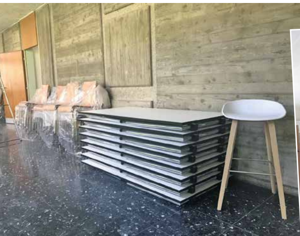
Les tables et les chaises livrées attendent sagement dans le couloir.