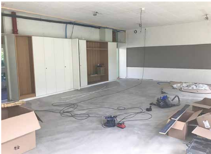
Cet été après la mise à nu des murs et du sol, tout a été refait à neuf. Ici les armoires et penderies viennent d'être posées.

Suite à l'approbation par l'Assemblée générale du budget de rénovation de la grande salle paroissiale de la cure au rez-de-chaussée, les travaux ont immédiatement commencé et duré tout l'été. La salle a pu être visitée à la sortie de la messe du dimanche 6 septembre. Petite déception, en raison des normes sanitaires compliquées le Conseil de paroisse n'a pas pu préparer un apéro paroissial. Ce n'est que partie remise et l'on se réjouit déjà du jour où cette pandémie sera derrière nous.