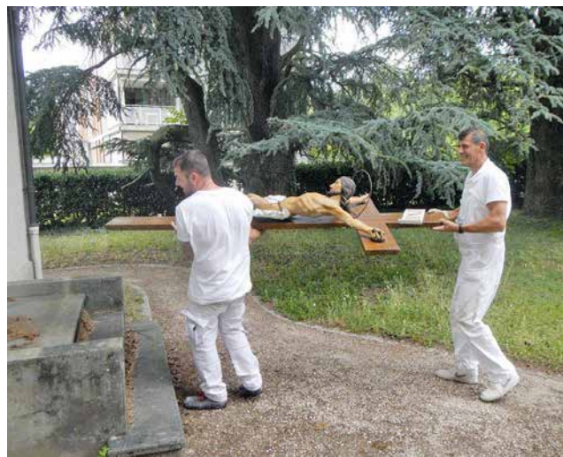
Remise en place de la croix.