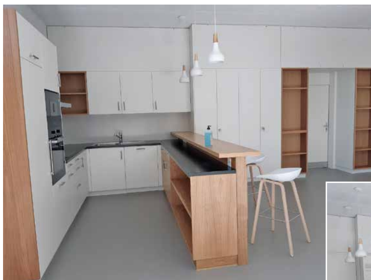
Septembre, les travaux sont finis, la cuisine se présente à nous.