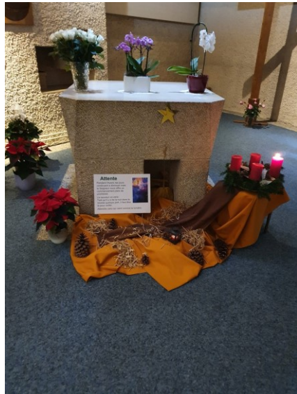
Couronne de l'Avent à Ste Marie

Cette la lumière sera celle de ma prière tournée vers toi comme un regard, car toi Seigneur, comme à Marie tu parles à chacun de nous dans le secret de nos cœurs.