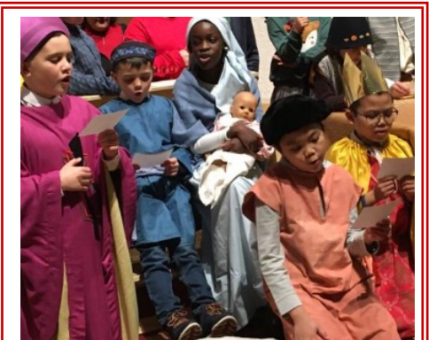
Noël 2019 à l'Epiphanie

Marie, cependant, retenait tous ces événements et les méditait dans son cœur. Les bergers repartirent ; ils glorifiaient et louaient Dieu pour tout ce qu'ils avaient entendu et vu, selon ce qui leur avait été annoncé.