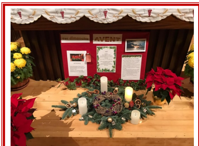
Couronne de l'Avent à Cointrin

Cette lumière sera celle de mon sourire offert à tous comme un cadeau, car toi Seigneur tu viens pour la joie de tous.